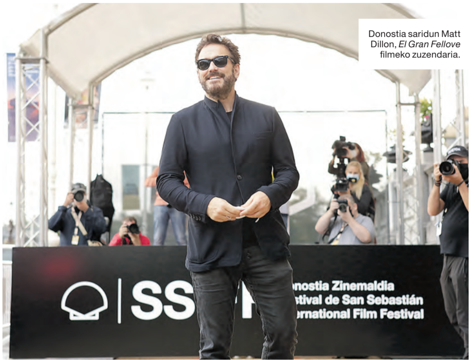
Donostia saridun Matt Dillon, El Gran Fellove filmeko zuzendaria.