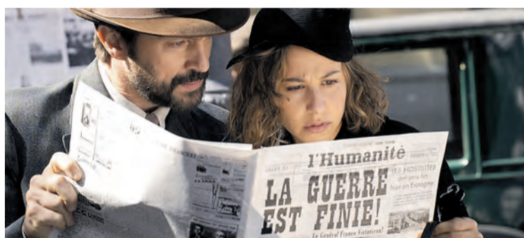
Dime quién soy .