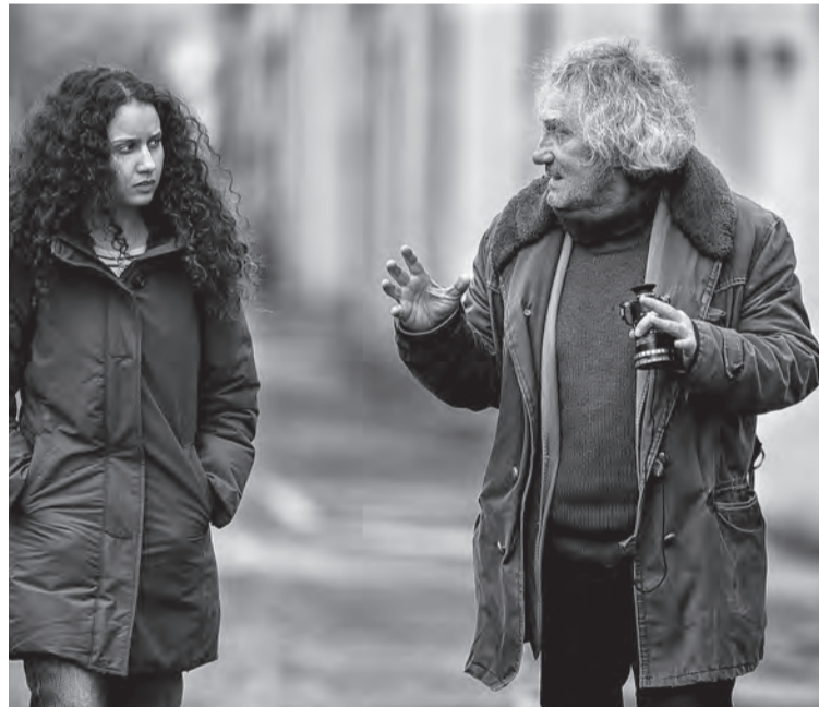
Oulaya Amamra y Philippe Garrel en el rodaje de Le sel des larmes .

El otro hijo de Garrel y Sy, Louis, visitó el Zinemaldia en 2008 como protagonista de La belle personne , una de las varias películas que ha hecho con Christophe Honoré. Y diez años después volvió con Un hombre fiel , su segunda experiencia como director, una película imbuida del