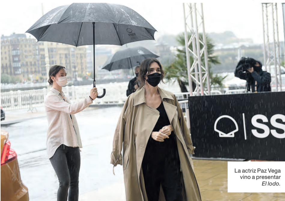
La actriz Paz Vega vino a presentar El lodo .