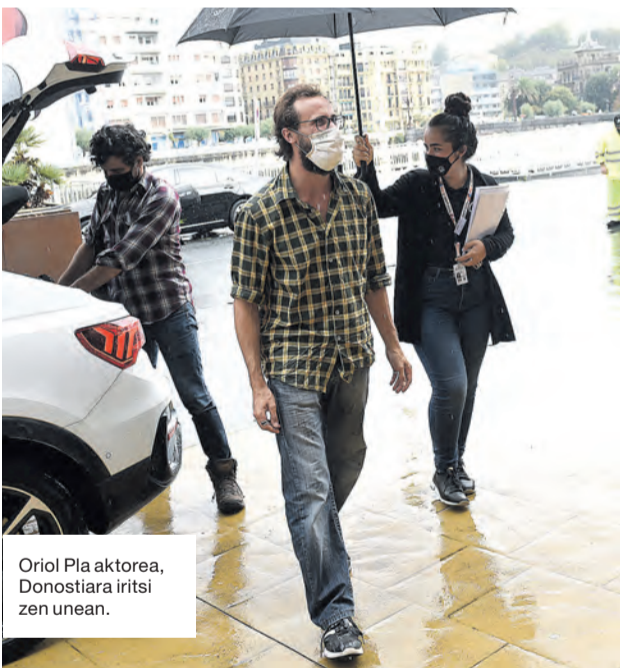
Oriol Pla aktorea, Donostiara iritsi zen unean.