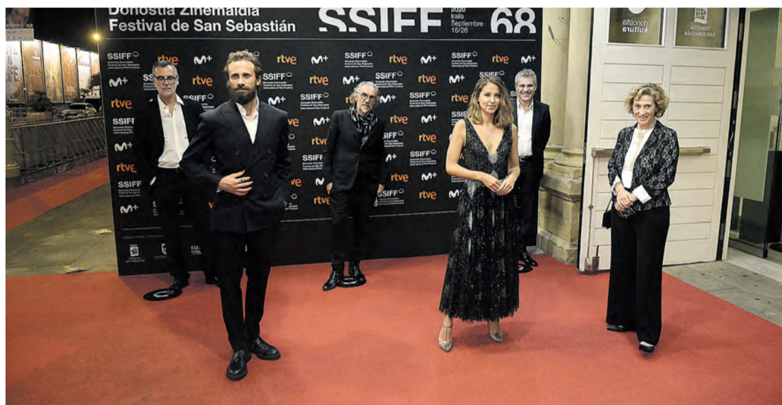
El equipo de la serie Dime quién soy junto a la escritora Julia Navarro (primera por la derecha).