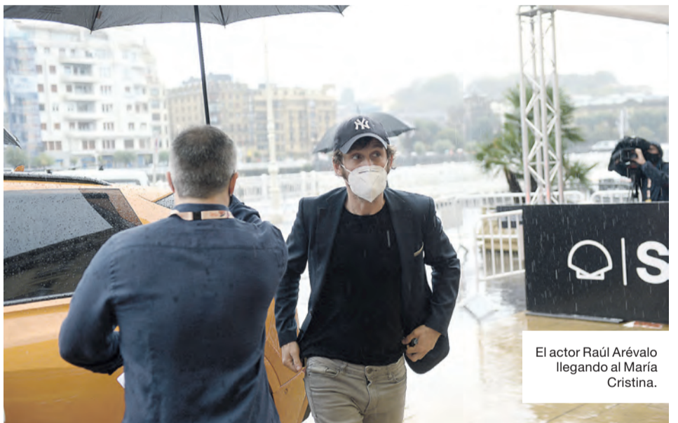
El actor Raúl Arévalo llegando al María Cristina.