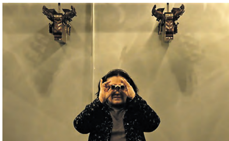
Binokl / Opera Glasses se proyecta hoy a las 12.15.

retratar la violencia, micro pero estructural, que vieron mientras crecían; en su caso, formando parte de las familias acomodadas que perpetúan la separación e incomunicación entre las distintas clases sociales. “Quise visibilizar como la arquitectura de las clases altas está pensada para hacer invisibles a sus trabajadoras domésticas”, constató la directora india Alisha Mehta ( Lata ), que usó su casa de propio decorado y nos aclaró que el uso de tres lenguas en la película —el inglés, el hindi (“usada como la lengua de opresión nacional”) y el marathi— marca los peldaños infran-