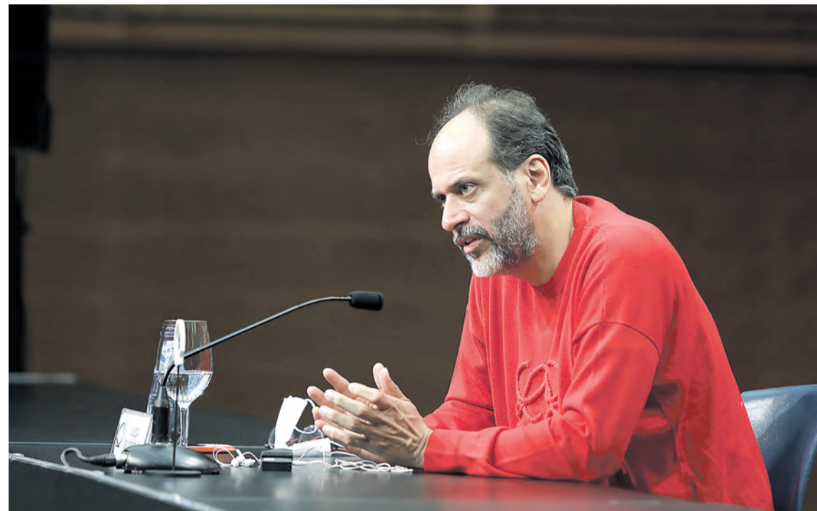
Zinemagile siziliarra kazetarien galderei adi.