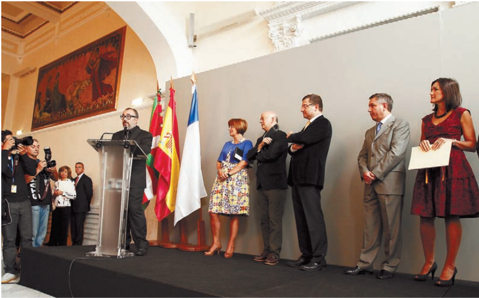
La ministra de Cultura entregó el Premio Nacional de Cinematografía 2010 al director Álex de la Iglesia.