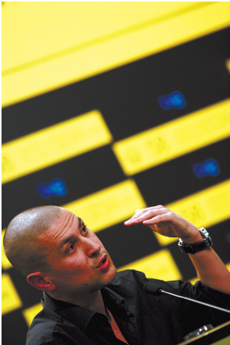
Zuzendari galiziarra, atzoko prentsurrekoan.