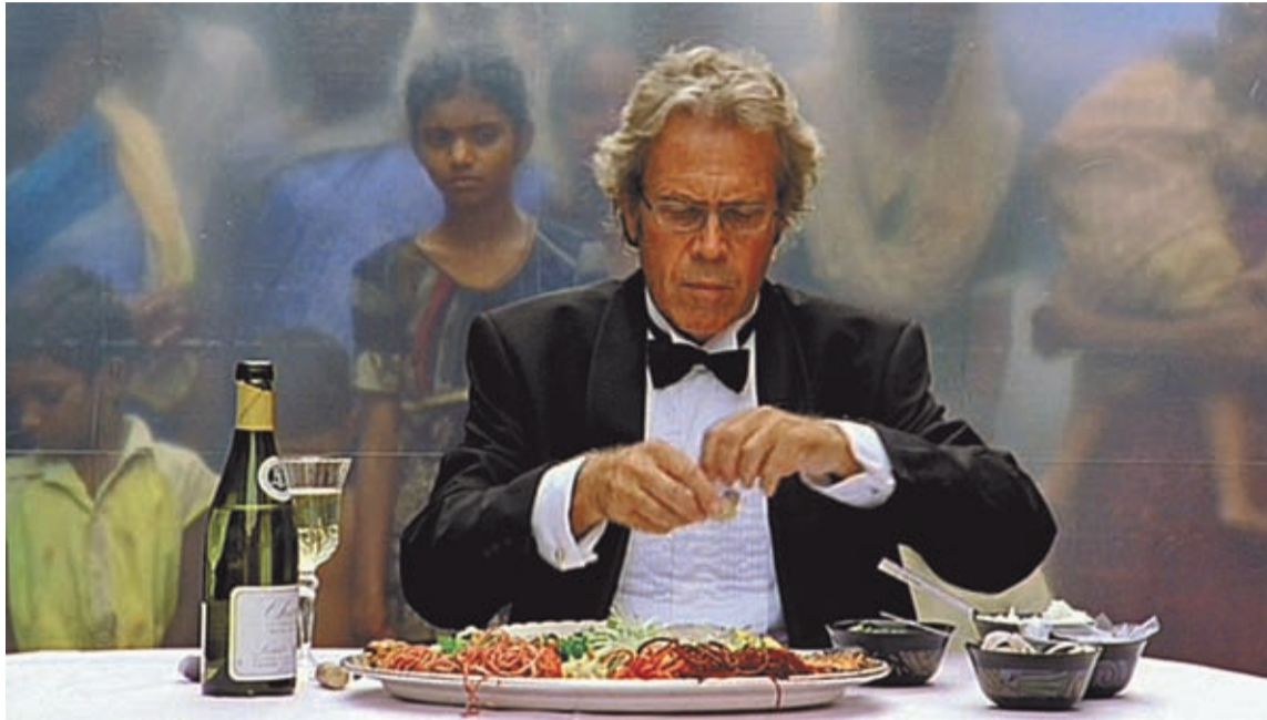
Leth maisua bidelagun hartuta, zinema sormenaz egiten du gogoeta Lars von Trier ilunak.