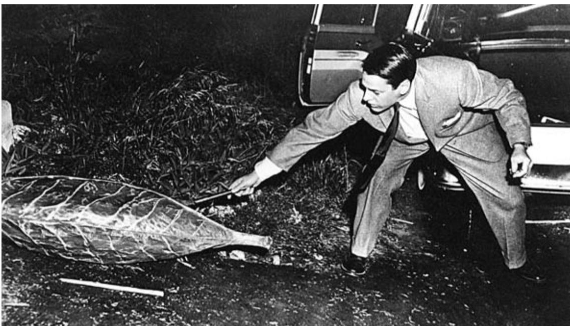
Siegel inauguraba con esta película el cine de la conspiración y la paranoia.