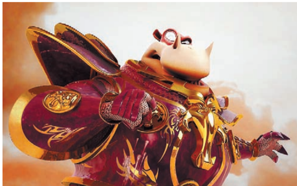
The Heart of the Oak.