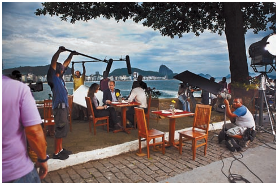
Shooting in Rio de Janeiro.

One year later, the consolidated Rio de Janeiro City and State Film Commis-