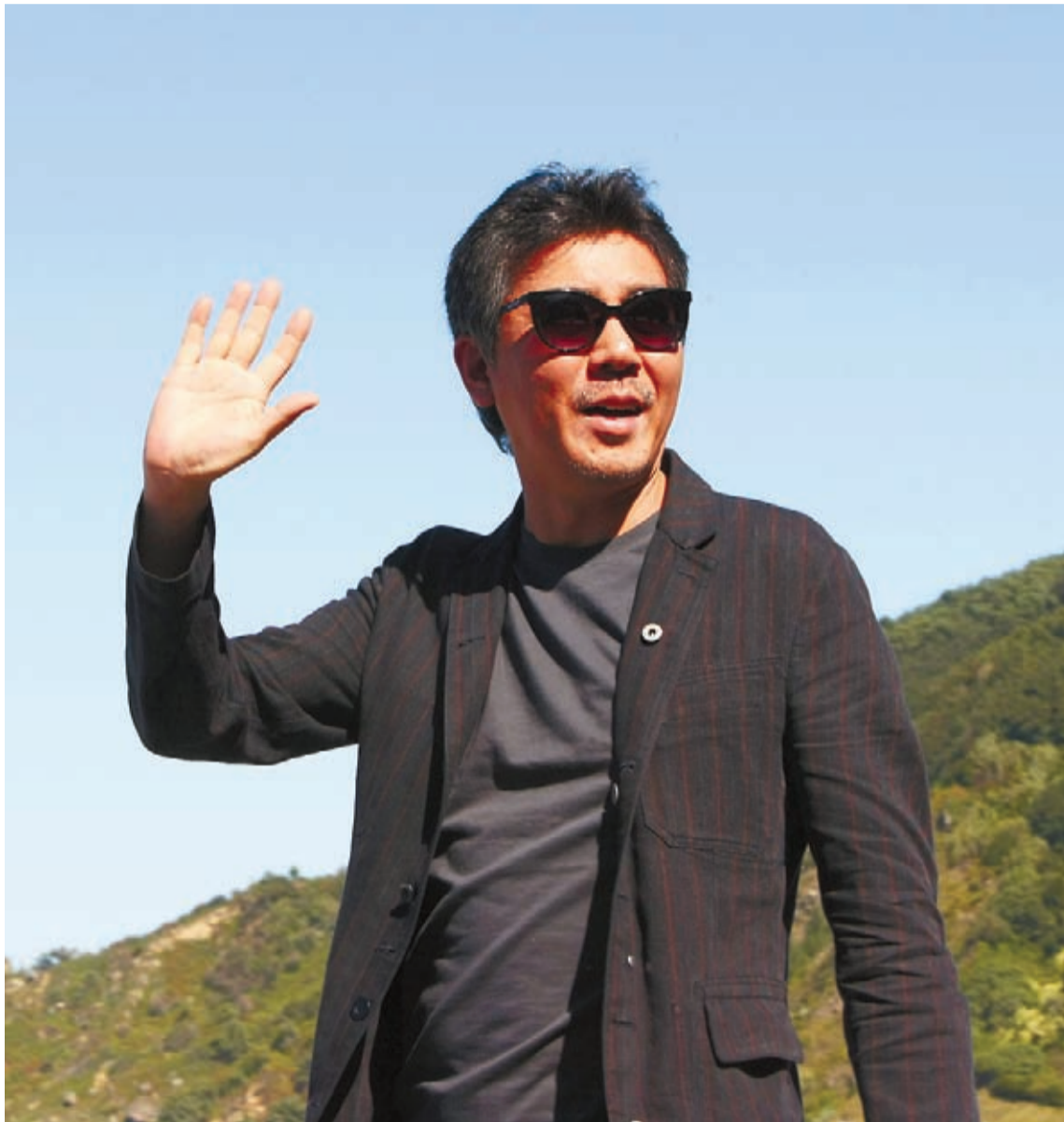
Eguzki izpiek kalte egiten al diote Kim Jee-woon zuzendari sarraskigileari?

I Saw the Devil filmak bi aktore protagonista antzezpen bikai-