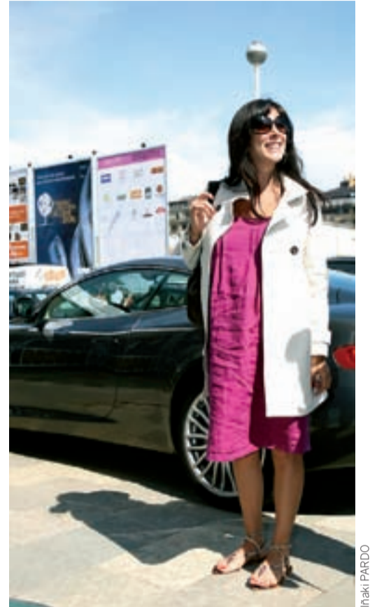
Nadine Labaki, epaimahaikoen 'goxokia'.