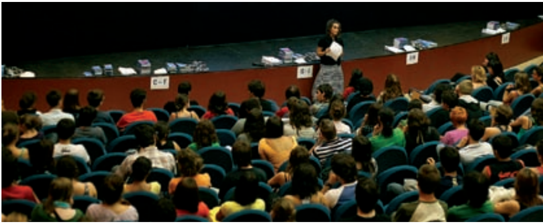
Gazteriaren Epaimahaiko partaideak egin beharreko lanaren nondik norakoak entzuten