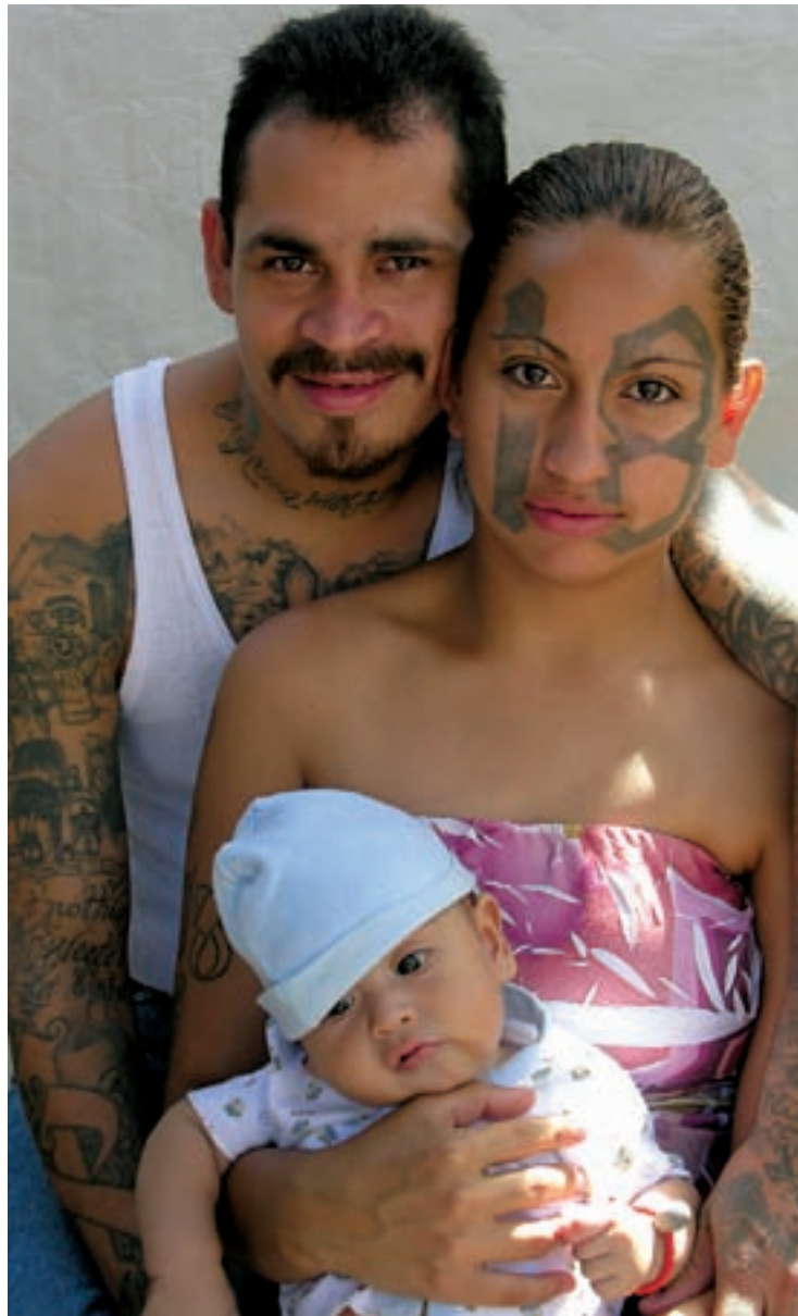
Integrantes de la mara "La 18", protagonistas de La Vida Loca .