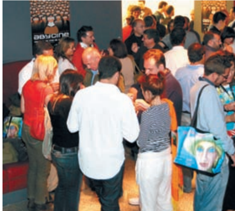
Another busy day at the Sales Office.

Germany's emerging as Europe's new film finance star; Cen-