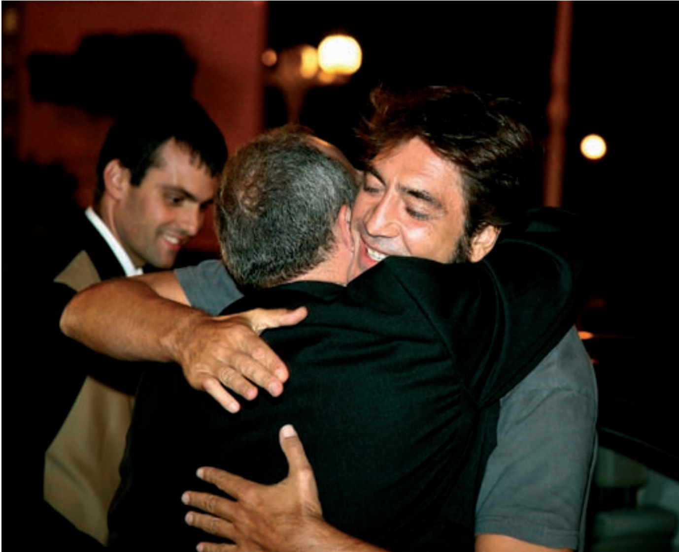
Javier Bardem, aurtengo Zinematografiako Sari Nazionala.

HEMENDIRAYAESTÁNAQUÍTHEY'REHERE!HEMENDIRAYAESTÁNAQUÍTHEY'REHERE!HEMENDIRAYAESTÁNAQUÍ