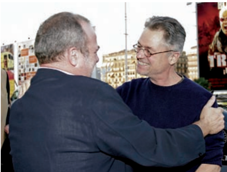
Jonathan Demme, Epaimahai ofizialeko buru. Arkume itxurako otsoa ote?

Javier Bardem y Rebecca Hall, compañeros de reparto de la tan esperada Vicky Cristina Barcelona , llegaron al caer la noche, con unos minutos de diferencia. La cinta de Woody Allen será la encargada de abrir Zabaltegi.