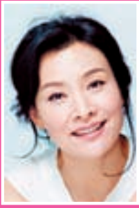
JOAN CHEN Presidenta

Era una estrella en China ya con 19 años. En 1981 viajó a EEUU para estudiar cine y allí ha trabajado en numerosas producciones, entre ellas, The Last Emperor (El último emperador, 1987), la serie Twin Peaks (1990) y Heaven and Earth (El cielo y la tierra, 1993). Al mismo tiempo, continuó haciendo cine en China. Su interpretación en Hong Mei Gui Bai Mei Gui (Red Rose and White Rose, Stanley Kwan, 1994) le valió numerosos reconocimientos. Se estrenó como directora con Xiu Xiu (The Sent-down Girl, 1999), a la que siguió Autumn In New York (Otoño en Nueva York, 2000). Entre 2003 y 2006 volvió a China para trabajar a las órdenes de Hou Yong, Zhang Yang y Jiang Wen. Interpretó también un papel en Se, Jie (Deseo, peligro, Ang Lee, 2007). Su último filme como actriz es el australiano The Home Song Stories (Tony Ayres, 2007).