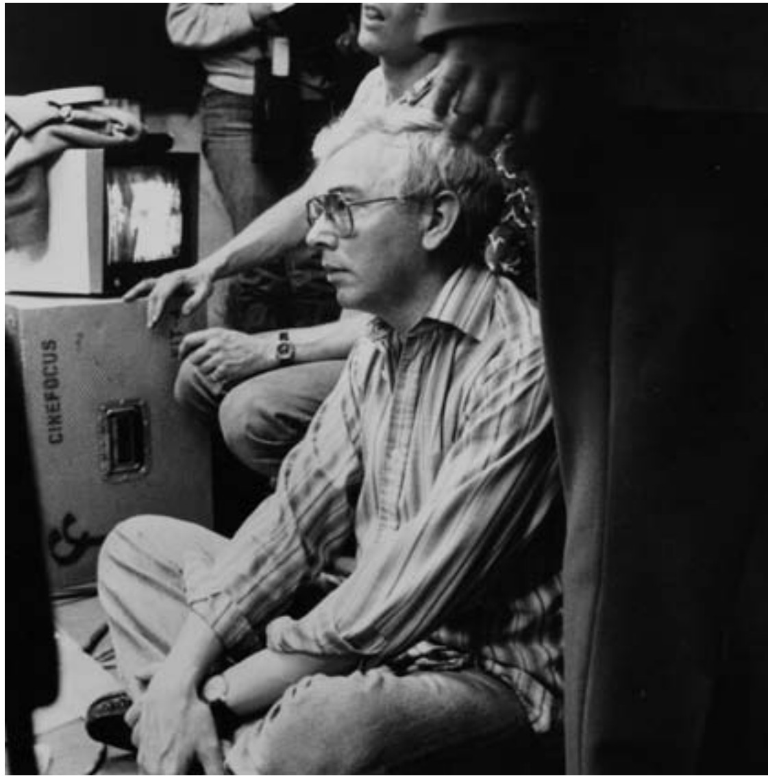
Terence Davies pelikula bateko lanean murgildua.

Soinuaren erabilera (pubetan abesturiko kantak, irratsaiozatiak, gramofono zaharretako diskoak, elkarrizketak eta irudiak sekula ikusten ez ditugun Hollywoodeko pelikuletako jatorria duten melodiak) ezaugarritu izan dute Daviesen lana eta memoriaren arima-itzultzearen bilaketa etengabea zehaztu du, entzundako musiken arabera bizitako iraganaren balorazioa, kontakizun lineal klasikoarekiko haustura, indibidualtasunetik