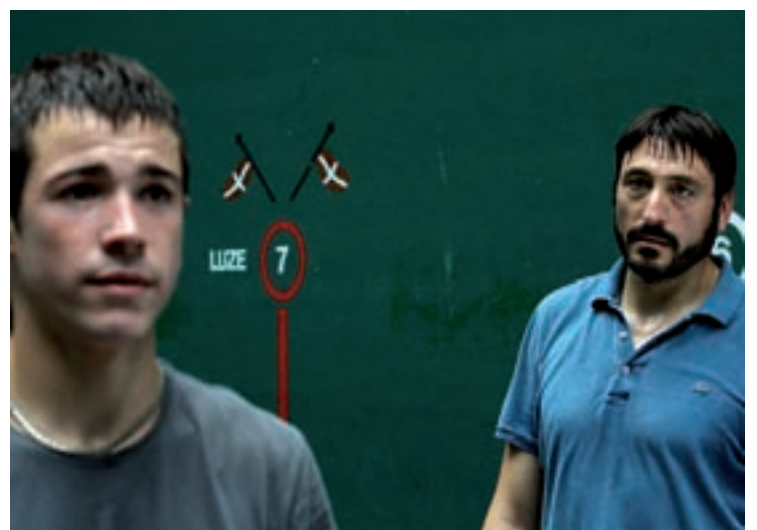
Gorka Merchánen La casa de mi padre filma 24an estreinatuko da.

Film laburrak deituriko atalak osotuko du egun berezi honen eskaintza. Batetik, 2007ko Kimuak katalogoko zortzi film laburrak emango dira, azken urtean na-