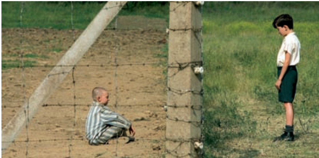
John Boyne-ren eleberrir arakastatsua oinarri duen Pijama marradunaz jantzitako mutikoa filmaren irudi bat.