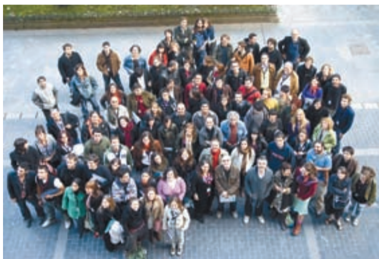
Los participantes de la pasada edición, encantados con la experiencia.

año por el director israelí Amos Gitai ( Kadosh, Edén, Free Zone ), escogerá el trabajo que será galardonado con el Premio aiTe [asociación de industrias técnicas del audiovisual español], consistente en servicios de post-producción por un valor de 6.000 euros para el director premiado. El jurado determinará también los nombres de tres directores que tendrán la posibilidad de participar con sus obras