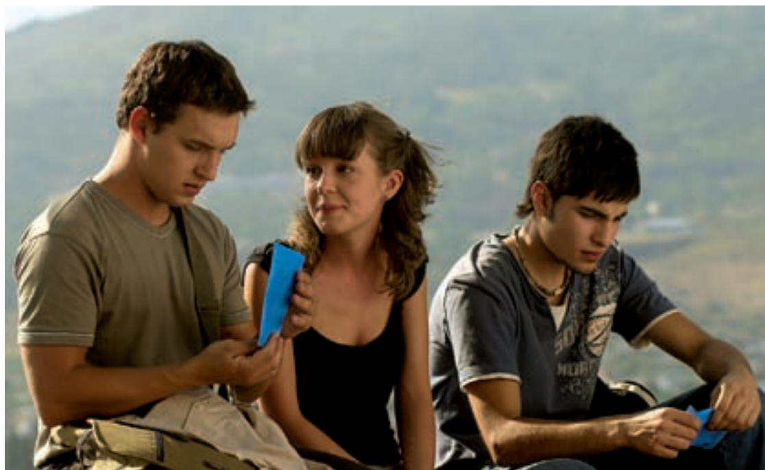
Pradolongo , ganadora del XV Premio Ciudad de San Sebastián Film Commission

A la lista también se suman producciones más pequeñas que han pasado por otros festivales: Lo mejor de mí , premiada en Locarno 2007; 3 días , ganadora del premio a la Mejor Película, entre otros galardones, en el Festival de Málaga; 3:19 , premio al Mejor Director en Málaga; y La zona , que obtuvo el Premio Fipresci en el Festival de Toronto.