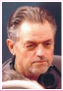
JONATHAN DEMME Presidente

Ha destacado como director y como productor. Sus películas han recibido veinte nominaciones a los Oscar y, en concreto, The Silence of the Lambs ( El silencio de los corderos ) obtuvo cinco estatuillas en 1991, entre ellas, la correspondiente a la mejor dirección. Otros títulos significativos en su filmografía son Philadelphia (1993) o The Manchurian Candidate ( El mensajero del miedo , 2004). Su último largometraje, Rachel Getting Married ( La boda de Rachel ) será proyectado en la clausura de Zabaltegi. Además, Demme ha prestado especial atención a lo largo de su carrera al documental. En esta faceta destaca su serie Right to Return , sobre el Nueva Orleans post-Katrina. Actualmente monta Neil Young Trunk Show: Scenes From a Concert ; y, asimismo, prepara una cinta sobre Bob Marley.