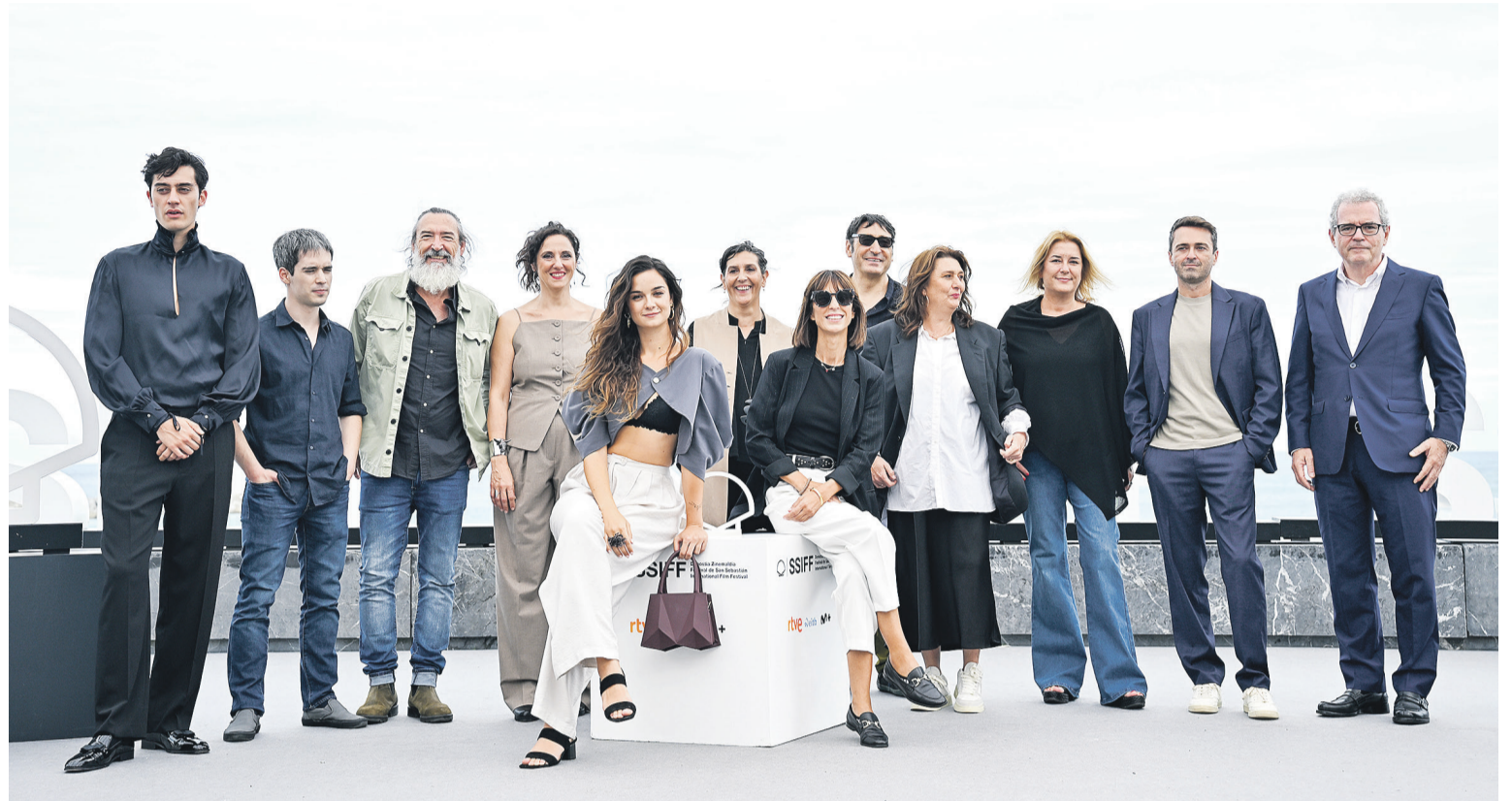
El equipo de La sombra de la tierra durante la presentación de la serie en el Zinemaldia.