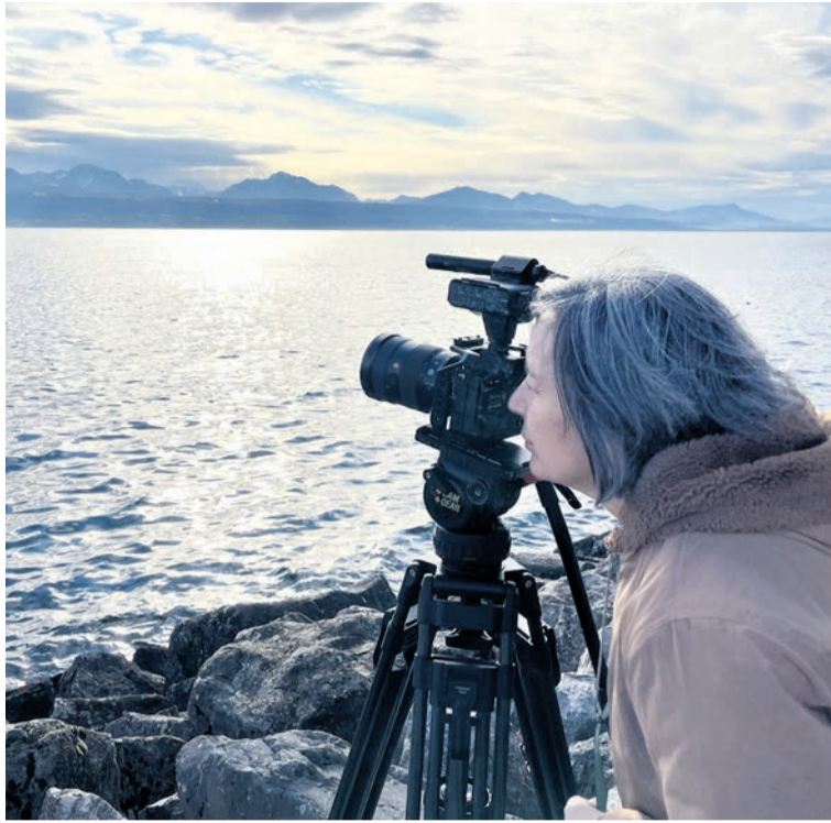
Arantxa Aguirre zinegileak bere azken film luzea aurkeztuko du Zinemiran.