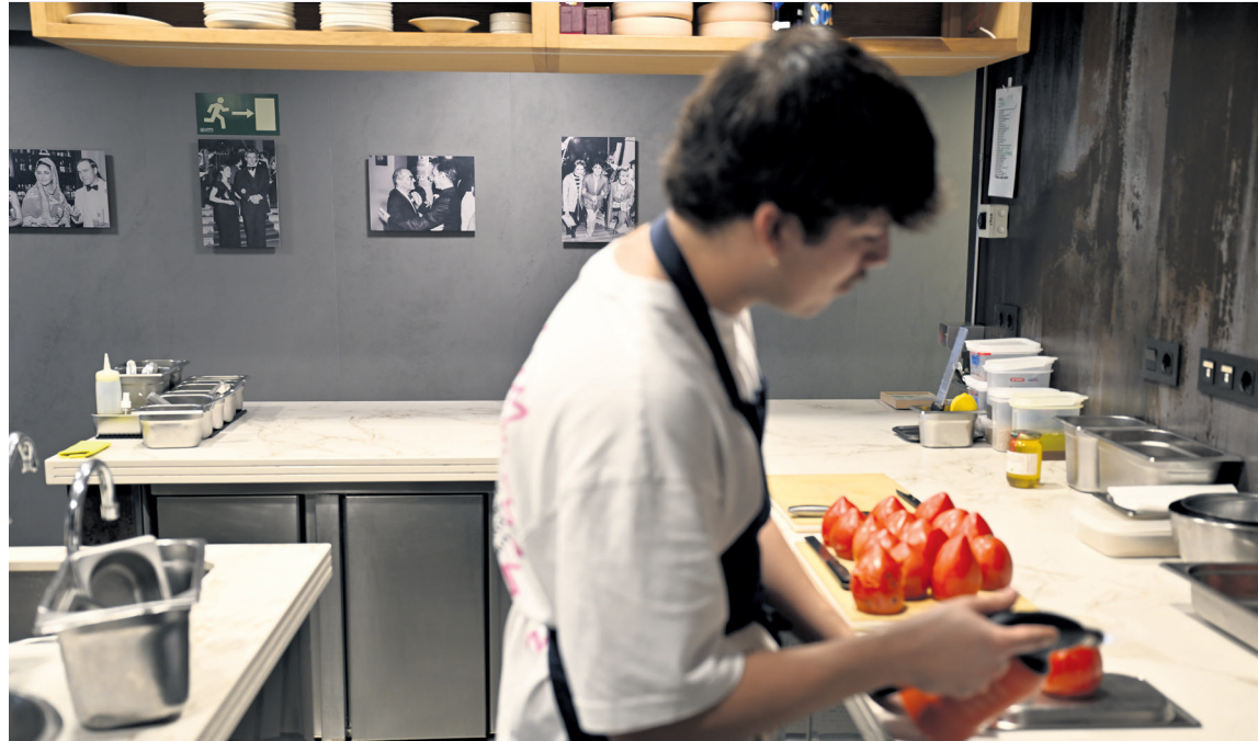
La cocina de Muka con la exposición de fondo.