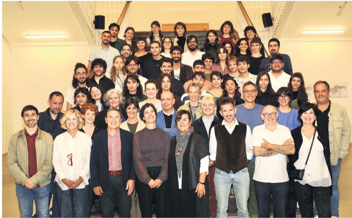
Representantes de Elías Querejeta Zine Eskola, del Festival e instituciones con las alumnas y alumnos del curso 2024-2025.