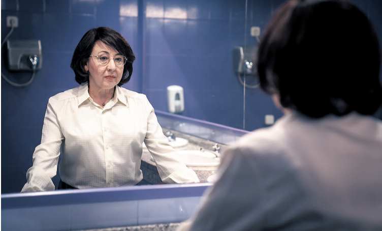
Carmen Machi bere islarekin aurrez aurre, Celeste telesailen.