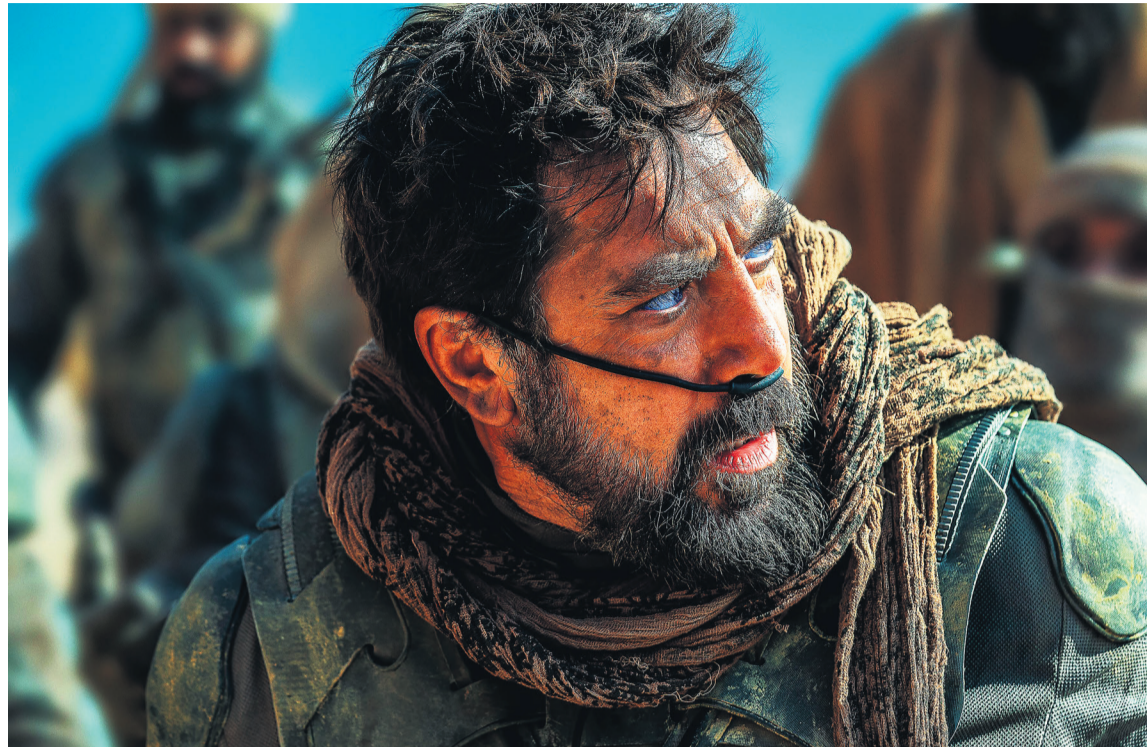
Bardem protagonista de la saga Dune .

Pero no solo ha hecho villanos. Su versatilidad le ha llevado a múltiples cambios de registro y a trabajar