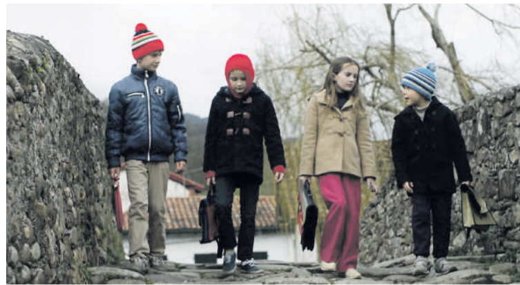
Bizkarsoro filmeko irudi bat.

Zinemaldian eman aurretik estreinatutako direlako lehiaketaz kanpo egon arren, beste sei filmek osatuko dute Zinemira saileko programazioa. Es-